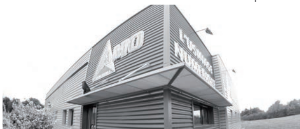
AMO GOURDEL - Z.A. La Verduze - 85170 BELLEVIGNY

2018 Incorporation de notre 4ème centre d'usinage ainsi que d'un banc de prééclage outils pour l'ensemble de nos commandes numériques.