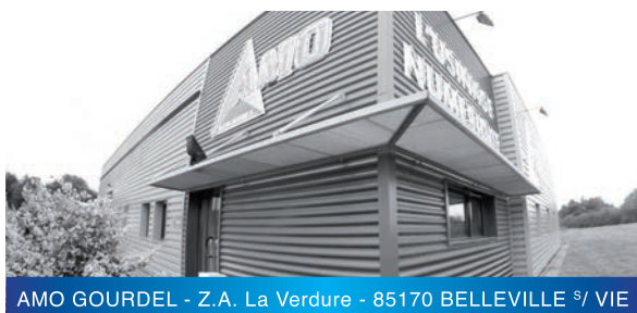
AMO GOURDEL - Z.A. La Verdure - 85170 BELLEVILLE 9/ VIE